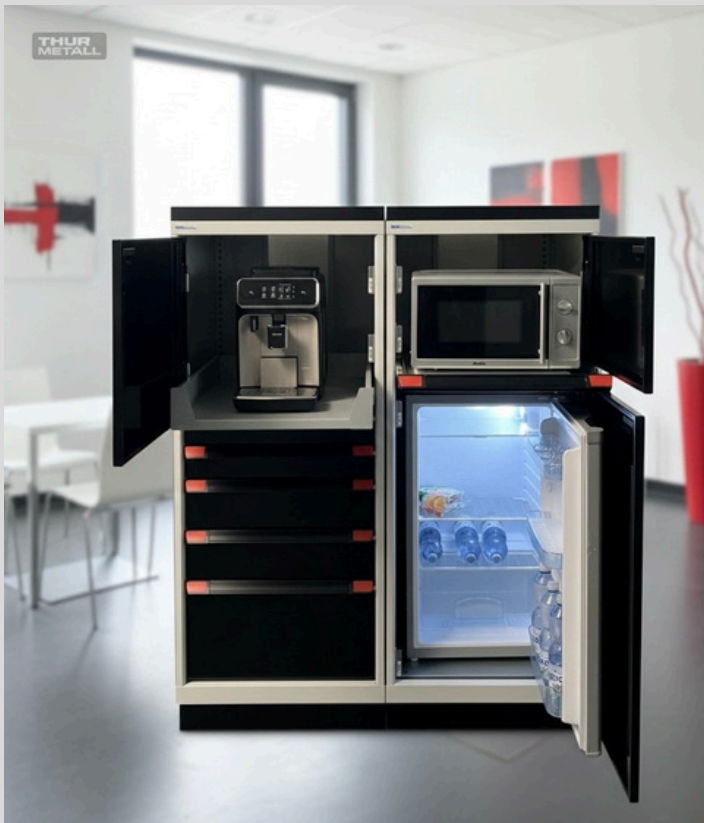
Lieferung ohne Küchengeräte

Vier geräumige Schubladen bieten organisierten Stauraum für Kaffeebohnen, Zucker, Besteck und Tassen. Alles ist griffbereit und sicher verstaut.