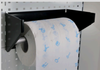
Papierrollenhalter (L) 360 mm für Rolle 400 mm schwarz Artikel-Nr. 81.058.000