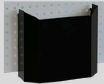
Abfallbehälter 14 Liter (BxHxT) 380x300x120 mm schwarz Artikel-Nr. 81.085.000