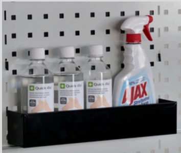
Spraydosenhalter (BxHxT) 380x74x70 mm schwarz Artikel-Nr. 81.083.000