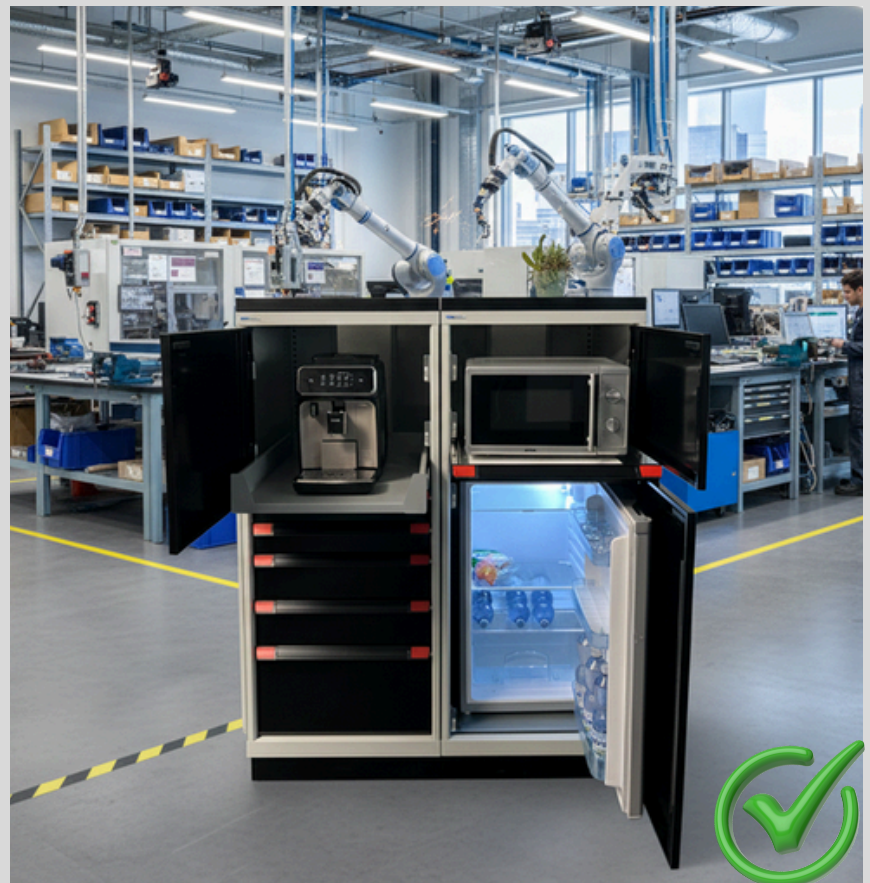
Lieferung erfolgt ohne Küchengeräte

Holen Sie sich jetzt Ordnung und Komfort in Ihren Betrieb. Kontaktieren Sie uns für ein unverbindliches Angebot!